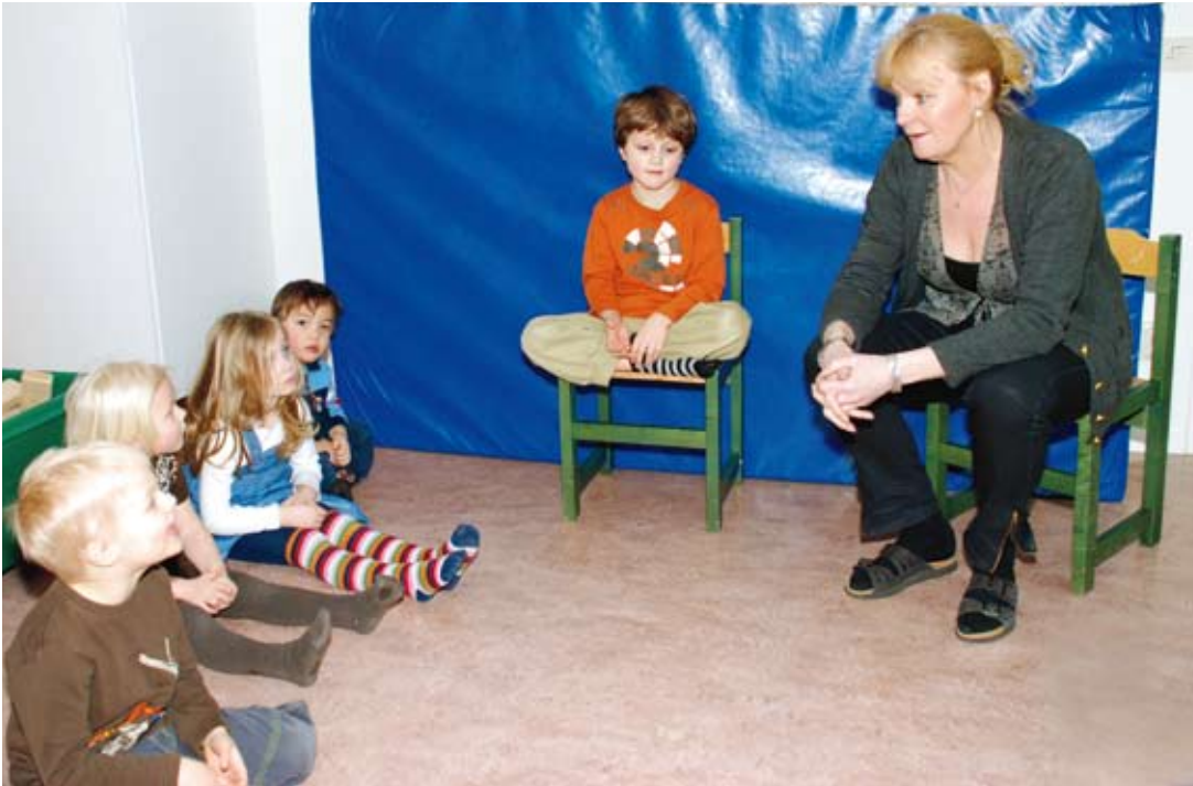
Genom att arbeta med bland annat Må-bra-stolen har barnen börjat se goda sidor hos varandra.