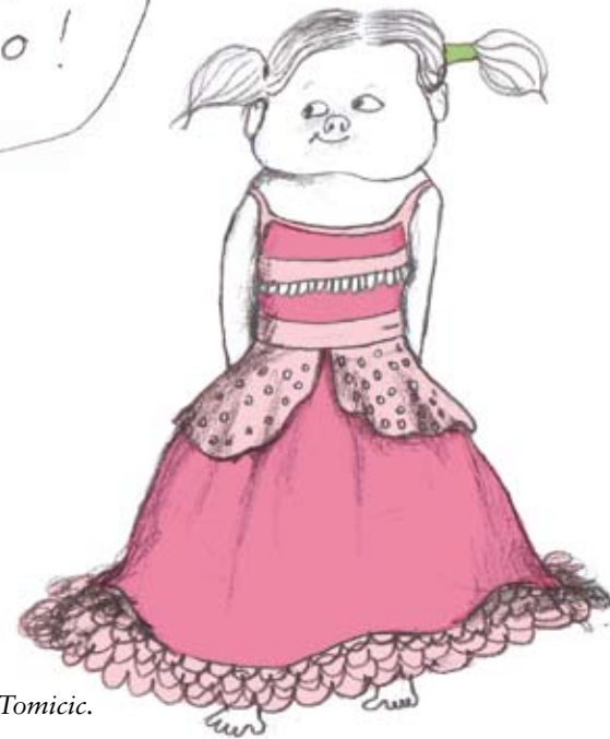
Ur boken "Ge ditt barn 100 möjligheter istället för 2" av Kristina Henkel och Marie Tomicic.

så avdramatiseras som könsstereotypa och istället fyllas med nytt fantasifullt innehåll.